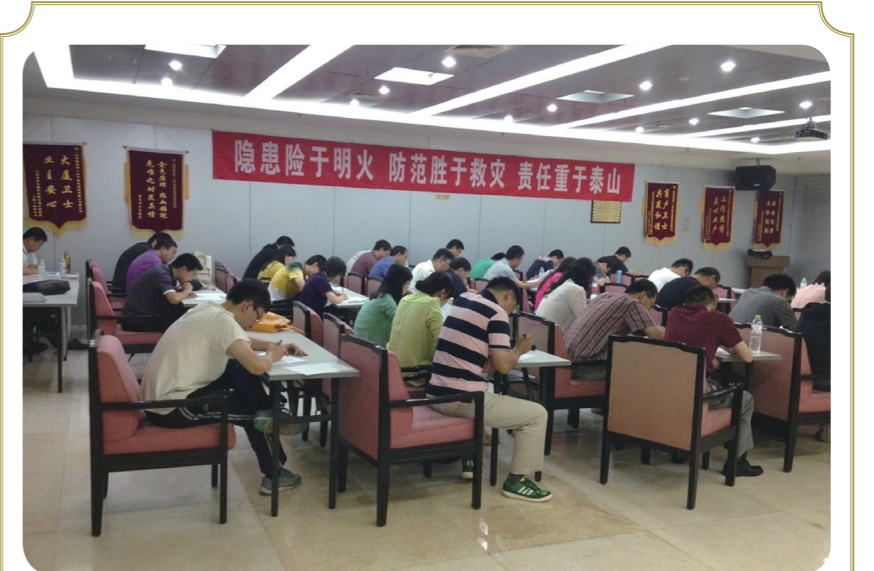
6月20日上午9点半至11点半，北科建集团统一举行了项目管理精细化改革培训考试，集团总部各部门、各分子公司共179人在七个考点参加考试。

下一步，在前期工作的基础上，集团将进一步做好项目精细化管理改革成果的推广、使用，加强项目精细化管理流程表单执行情况的过程检查，与各二级公司互动，及时优化、调整，在实践中完善，全面提高集团项目开发精细化管理水平。同时做好与职能体系精细化的协同，确保年内实现精细化管理的高效运行，为集团战略目标的实现提供坚强的管理保障。