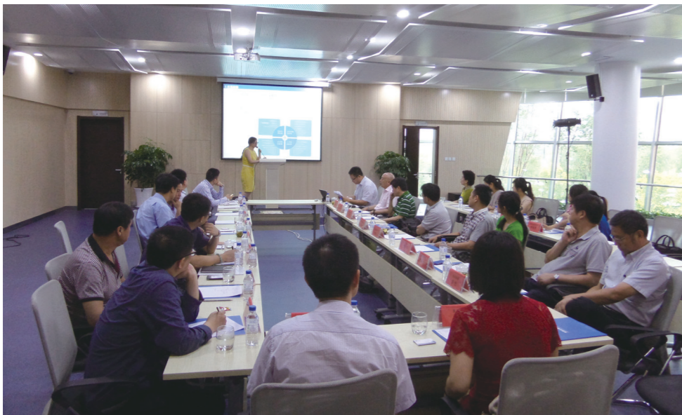
生物医药项目对接会

此次改革，集团、城市公司、招商管理公司之间做到了责权利明晰。招商公司作为集团统一的专业化招商平台统筹人员，集体培训员工，组织招商活动，有利于形成合力，真正做到主动出击，积累客户资源，又能建立起一支专业化、分工明确的招商队伍。减少管理层级，强化绩效激励是此次招商改革对招商体系建设的又一个重要特点，招商公司从招商经理到招商助理，每人有考核指标，指标和奖励公开透明，公平公正，人员薪酬市场化，通过薪酬制度、绩效考核与奖励办法三项激励制度，以年度指标匹配个人底薪提成，以正向激励为主的市场化招商体系架构目前基本形成。