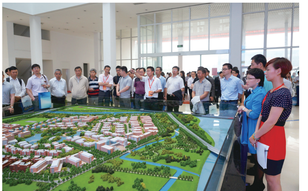
哈工大校友会参观无锡园区

长春公司结合东北老工业及招商客户群实际情况，以扶持中小企业入驻为主，结合国家振兴东北老工业