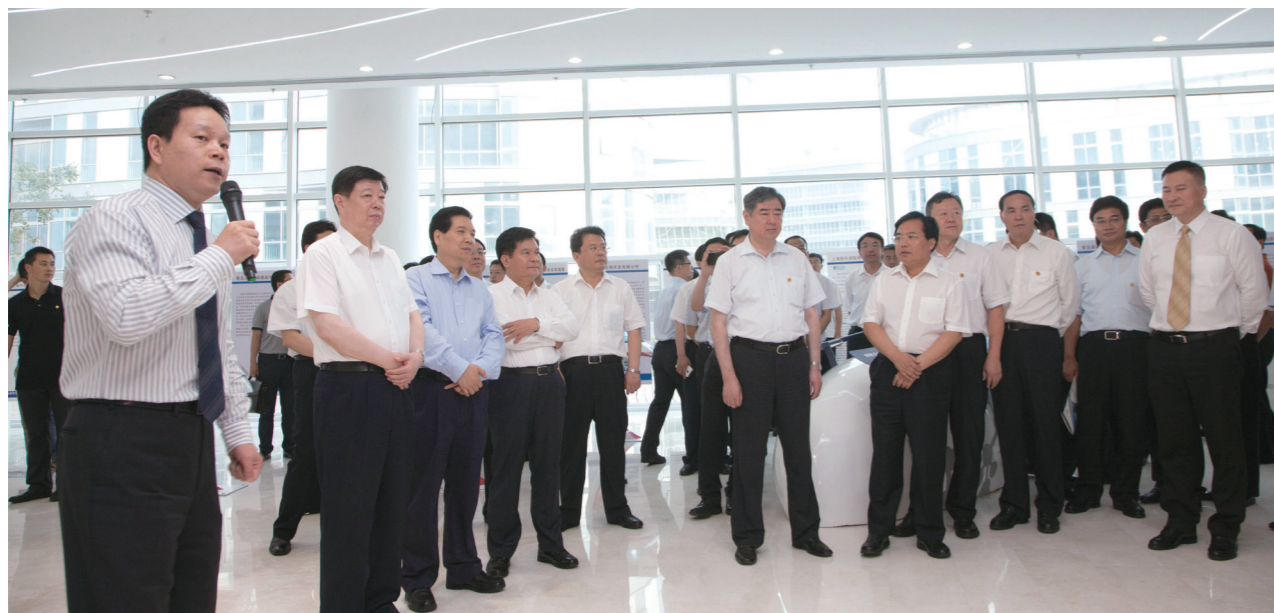
6月23日下午，中共云南省委书记、省人大常委会主任秦光荣和中共云南省委副书记、省长李纪恒在中共